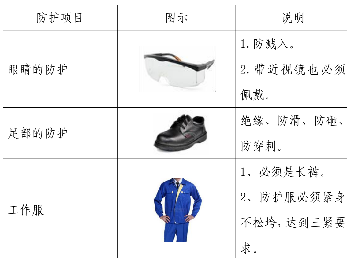
表 3 主要防护装备