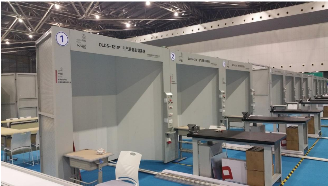
图 2 竞赛操作平台

选拔赛采用山东栋梁科技发展有限公司生产的型号为 DLDS-1214F 工作台，该工作间平台采用金属框架结构，安装工作面为木质板材。（正面尺寸长×高约 1.6m×2.4m，侧面尺寸宽×高约 1.2m×2.4m）。外形尺寸：呈梯形结构，外层由网孔板搭建。竞赛操作平台样例见图 2。