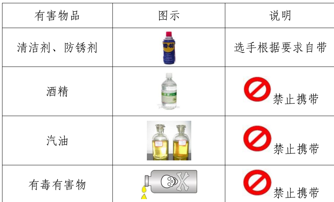
表 4 限制携带的易燃易爆物品