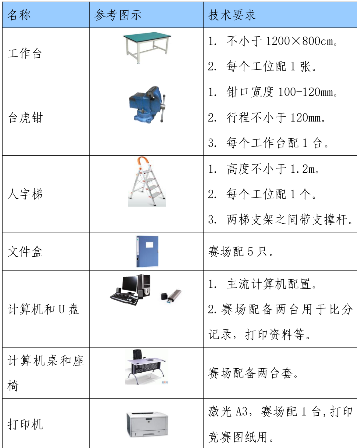
表 2 赛场提供主要设备