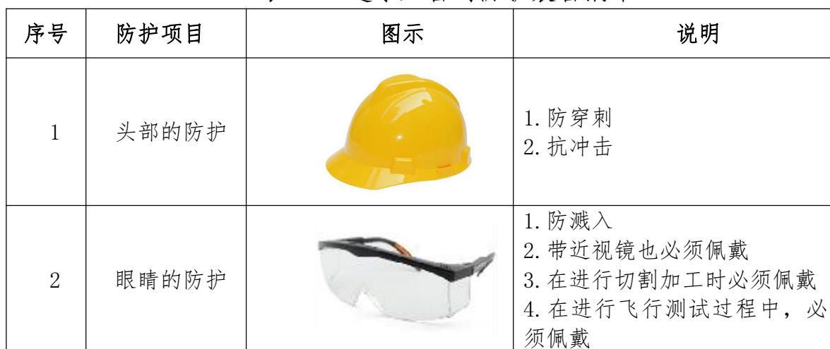
表 13 选手必备的防护装备清单